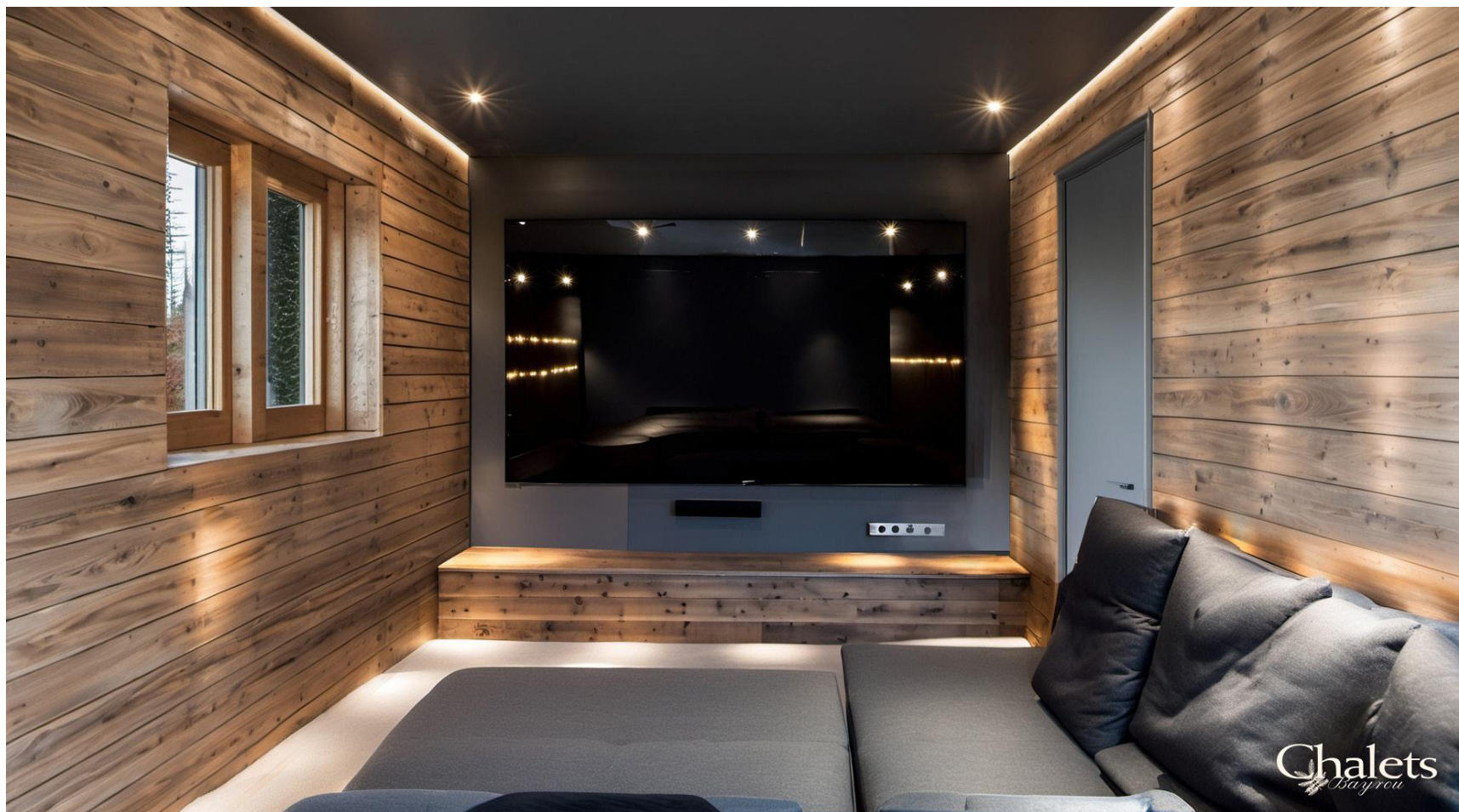
Salle de cinema / Home cinema