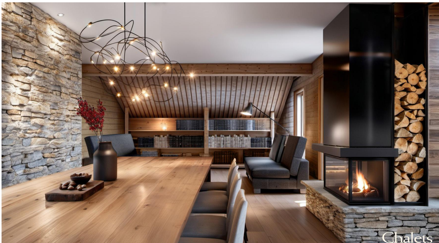
Salle de séjour / Living room