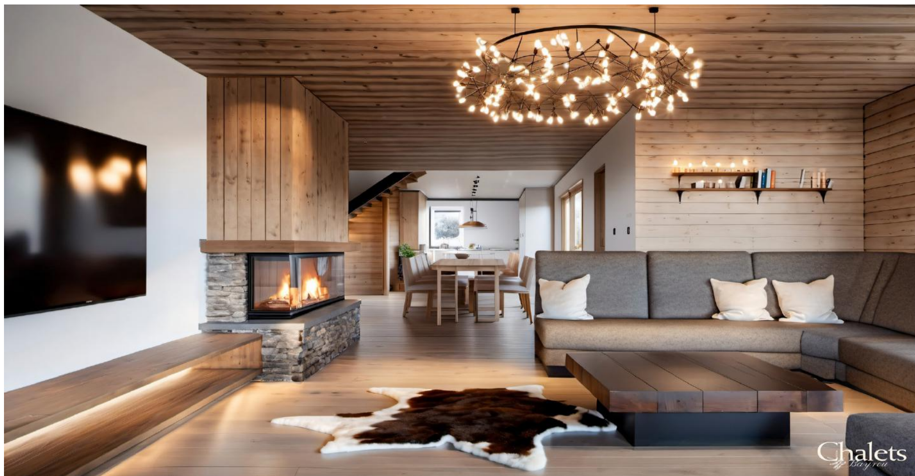
Salle de séjour / Living room