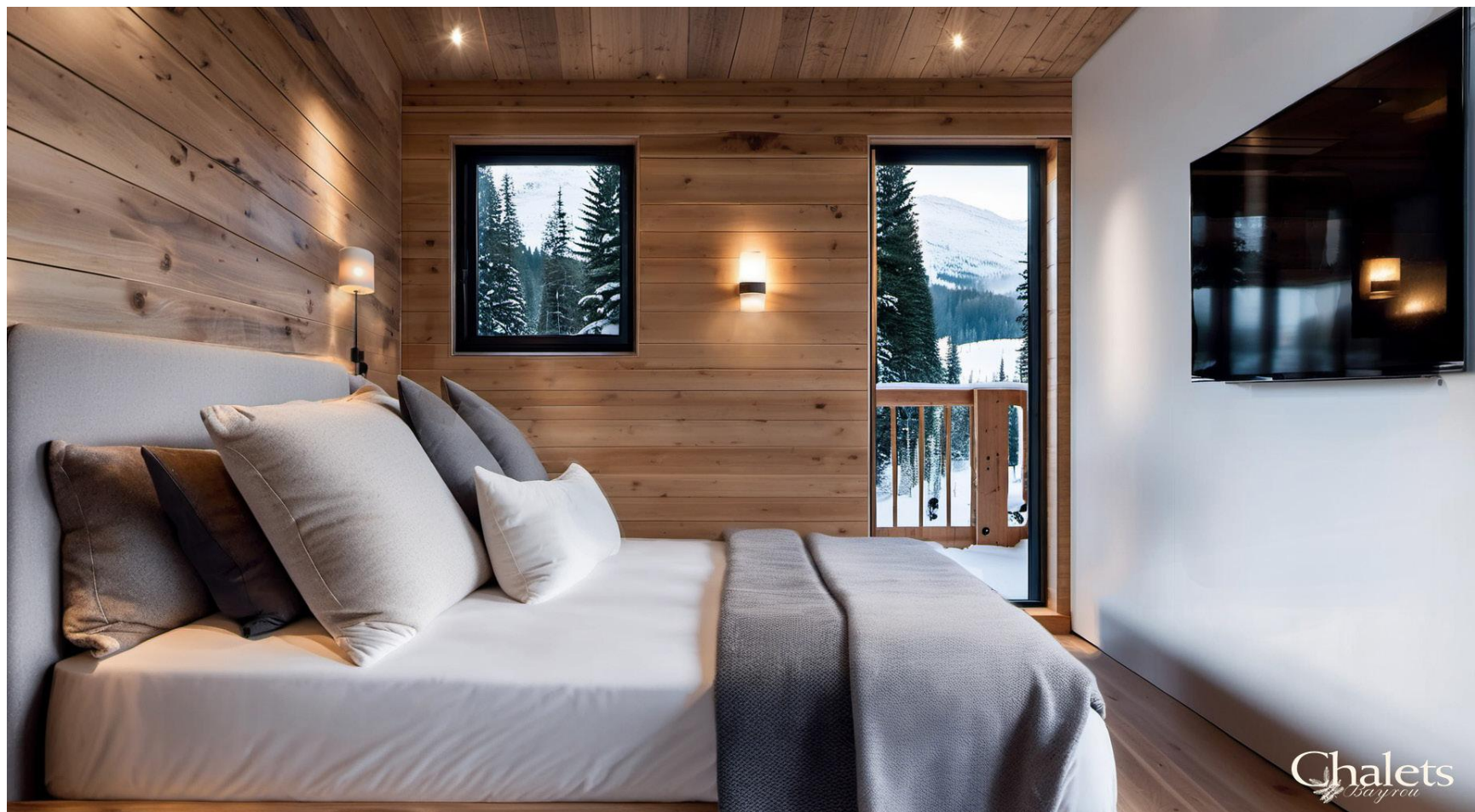
Chambre / Bedroom