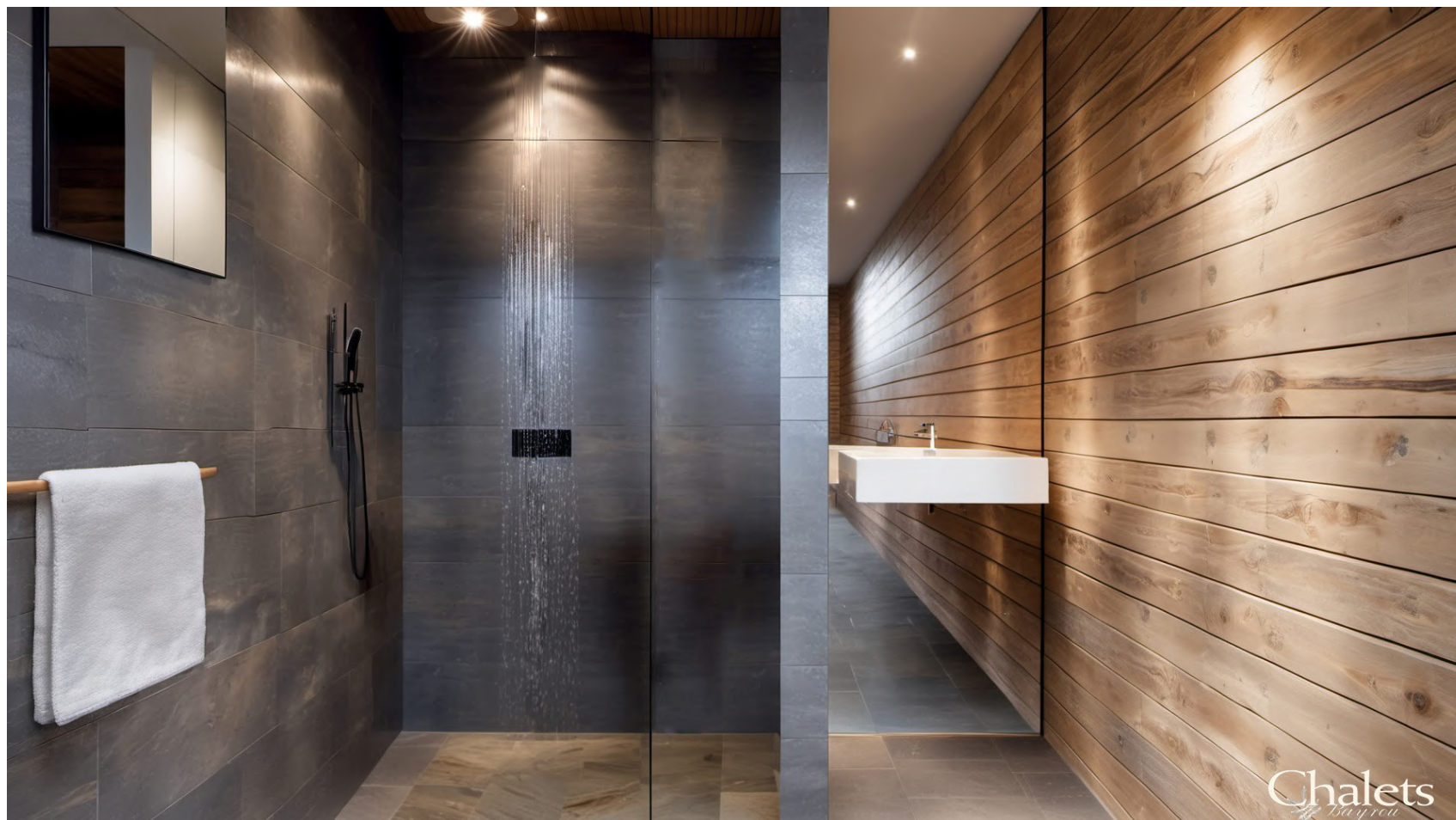
Salle de bains / Bathroom