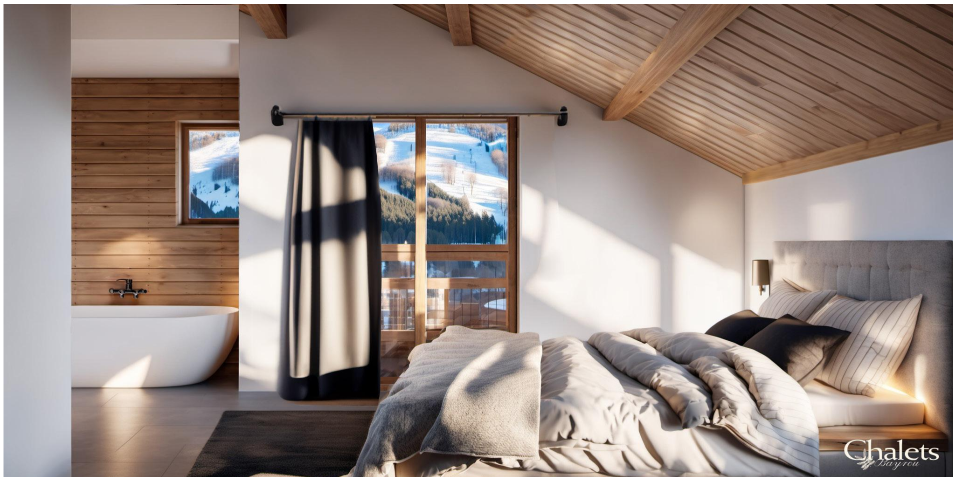
Chambre Master / Master bedroom