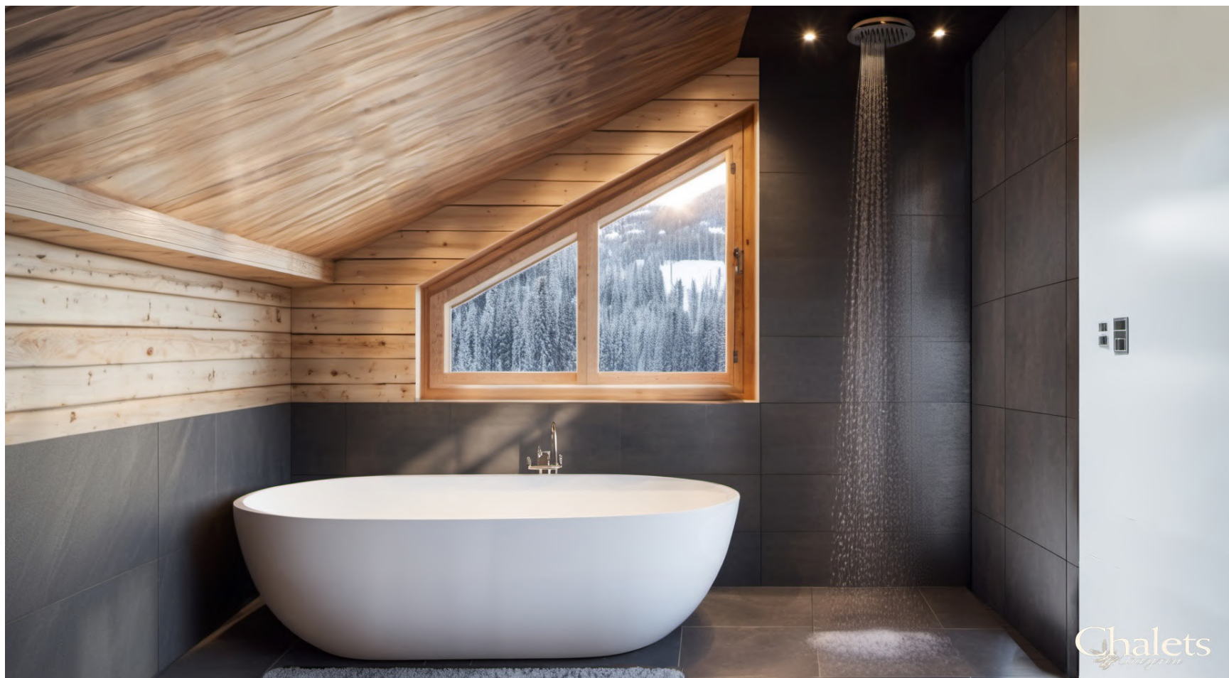
Salle de bains / Bathroom