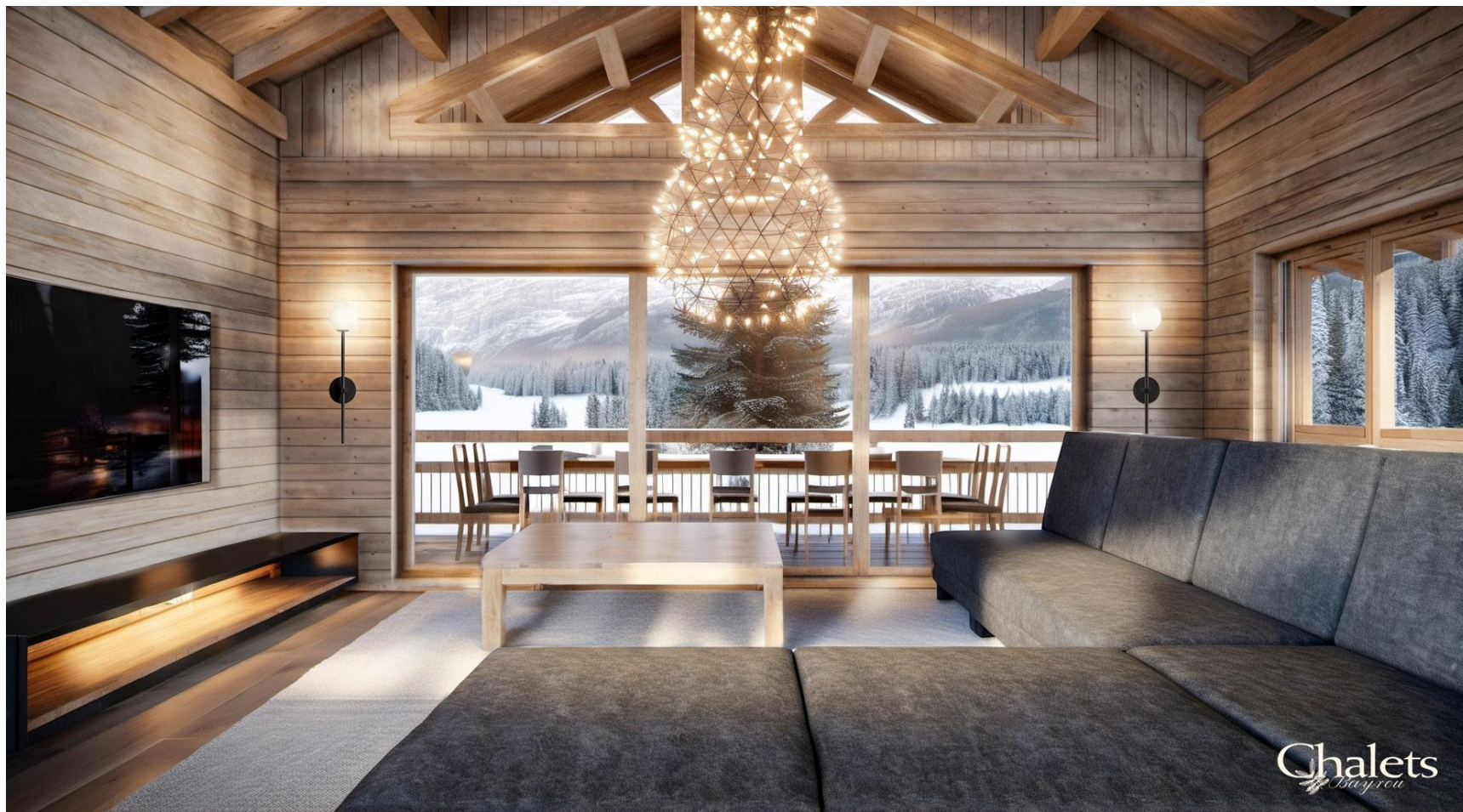
Salon / Lounge