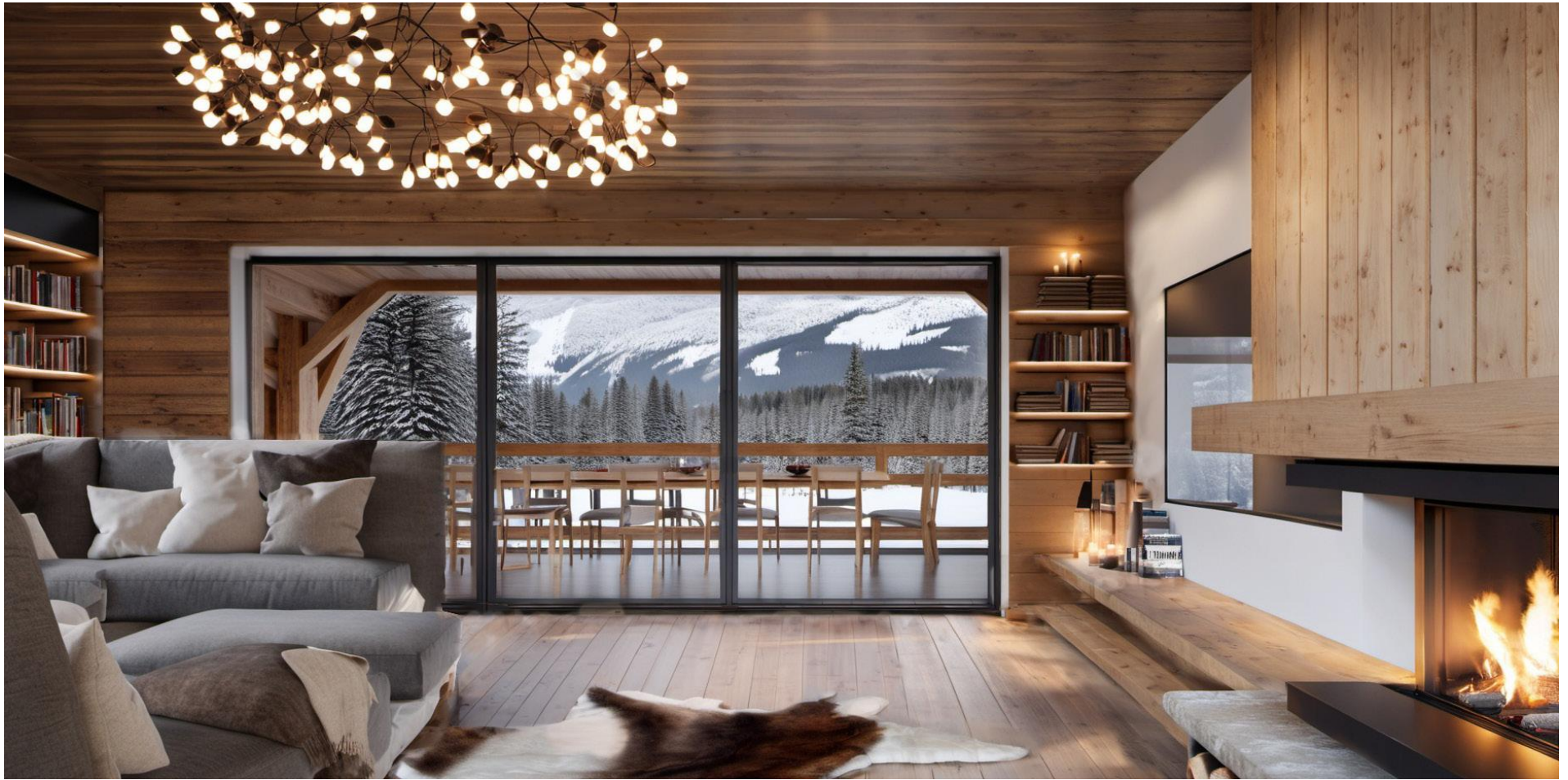
Salon / Lounge